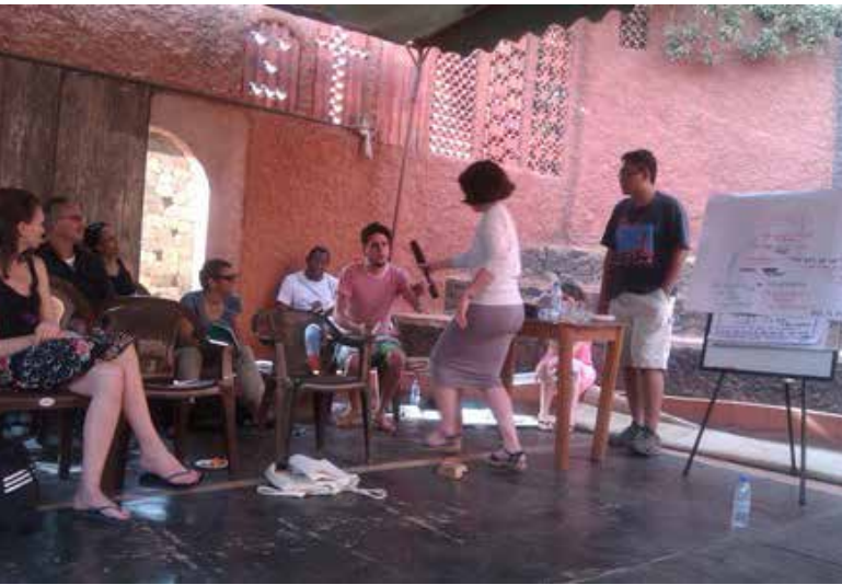
Océano Atlántico desde Dakar, Senegal

Bref le séjour à Dakar a été un moment de travail d'esprit et de réflexion.