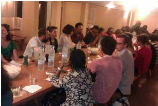
Diner après la séance de danse à l'école

La deuxième assemblée Art Collaboratory a été une très belle rencontre de partage et d'échange de connaissance. Pour ma part ça été la première fois d'y participer, mais cela a été comme si j'avais participé à plusieurs autres déjà avant. Cette rencontre m'a permis de bien comprendre et d'approfondir ma connaissance sur ma mission dans ma structure (Centre d'art Picha). J'ai compris qu'Art Collaboratory est un puits réversible des connaissances où chacun pouvait venir puiser et rajouter sa part de connaissance.