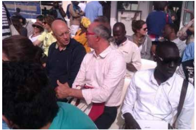
Sur le bateau en plein océan Atlantique