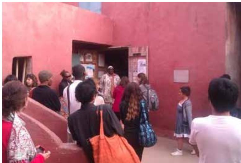
Explication du directeur de la maison des Esclaves