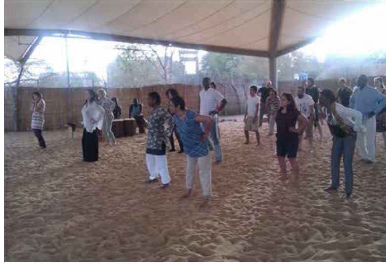
Séance de danse à l'école des sables