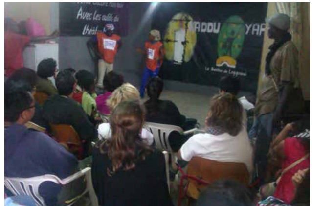
Les participants assistent à une pièce de théâtre forum de Kadou Yarax