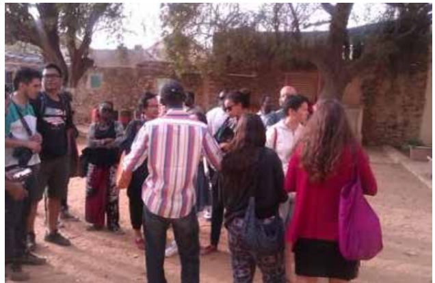
Explication du guide touriste sur l'île de Gorée